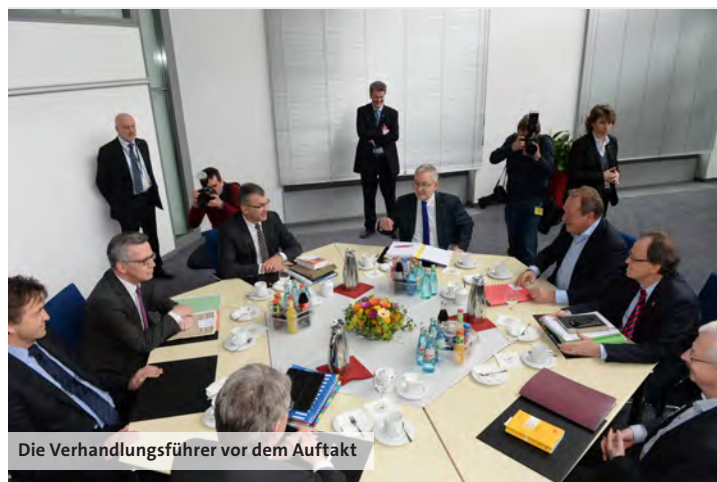
Die Verhandlungsführer vor dem Auftakt