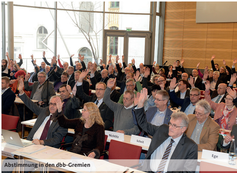
Abstimmung in den dbb-Gremien